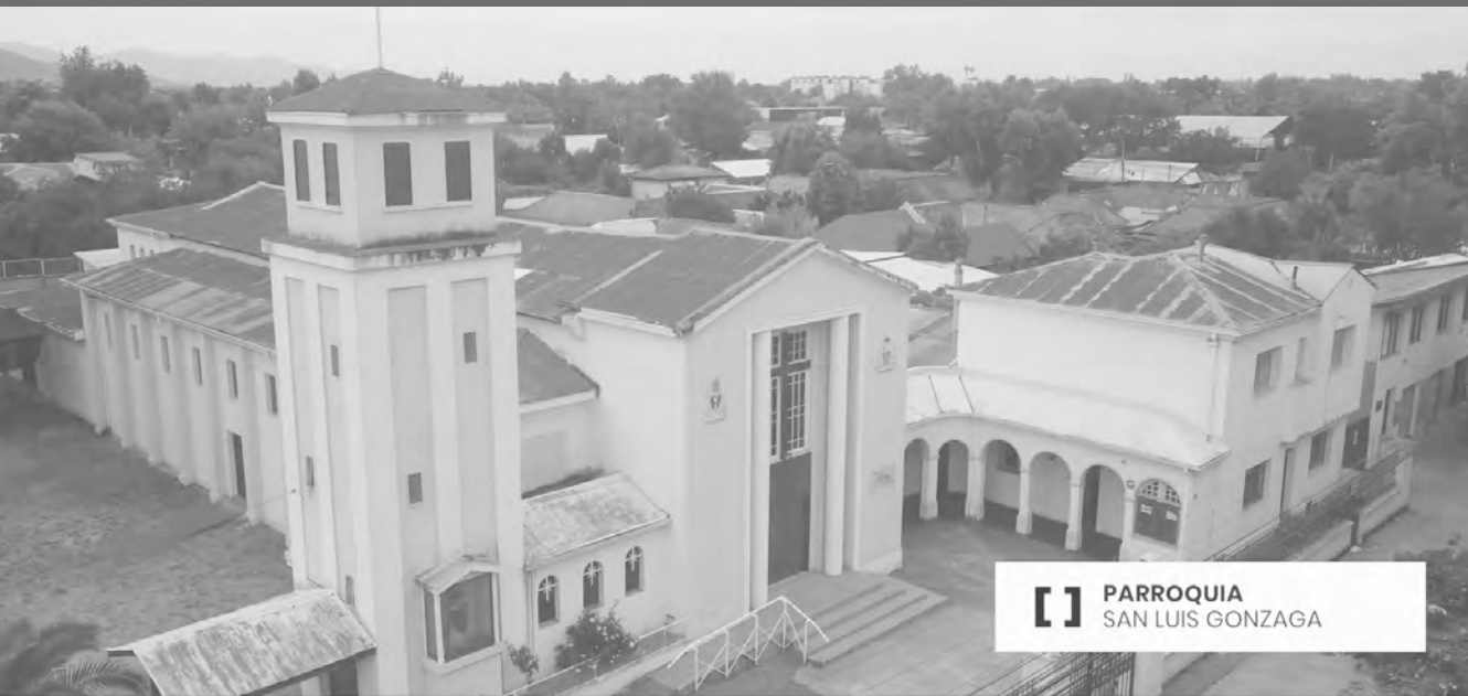
[ ] PARROQUIA SAN LUIS GONZAGA