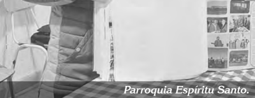
Parroquia Espíritu Santo.

Desde la Asamblea Diocesana del 2023, cuando se presentó el libro "Historia de fe de una Iglesia misionera al servicio del Reino", como signo del camino que empezamos a recorrer hacia nuestro centenario como diócesis, parroquias y diversas instancias pastorales han contado en las páginas de este libro su historia.