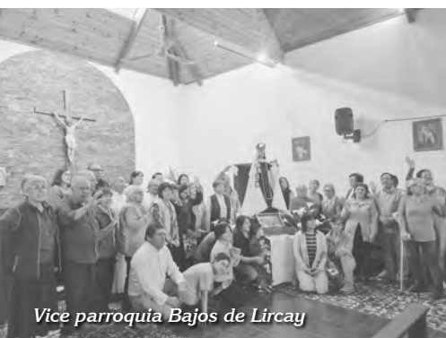
Vice parroquia Bajos de Lircay