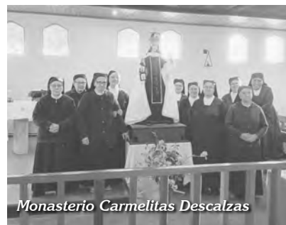
Monasterio Carmelitas Descalzas