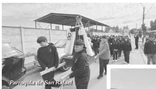
Parroquia de San Rafael