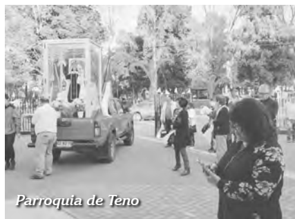
Parroquia de Teno