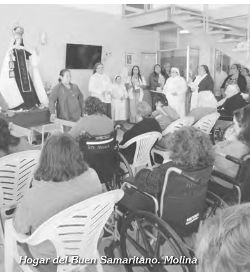
Hogar del Buen Samaritano. Molina

En los dos meses previos a la celebración del 18 de Octubre, la Virgen del Carmen de Huenchullamí nos acompañó por toda la diócesis, siendo signo de comunión de una Iglesia agradecida por su historia centenaria y por los más de 400 años de evangelización en nuestras tierras. Compartimos algunas imágenes de las últimas semanas de este peregrinar.