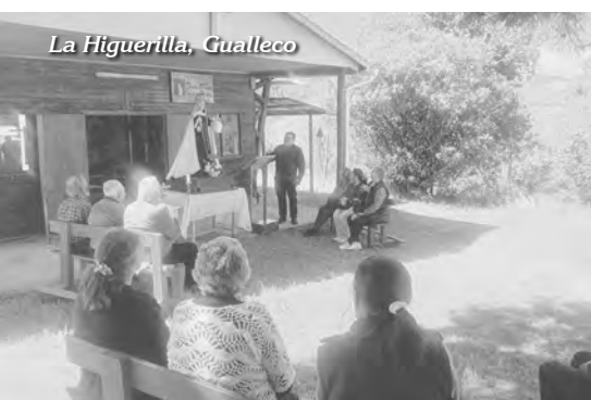
La Higuerrilla, Gualleco