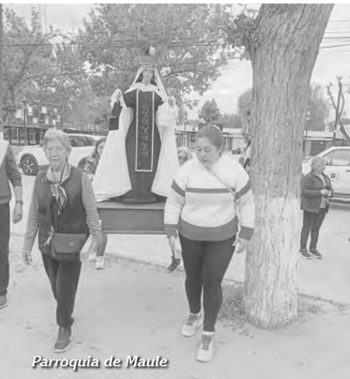
Parroquia de Maule