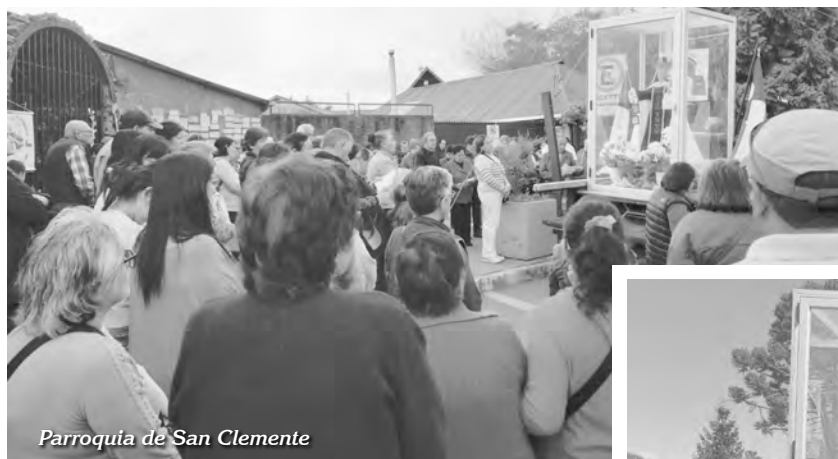
Parroquia de San Clemente