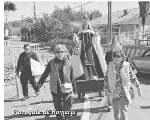
Parroquia de Romeral