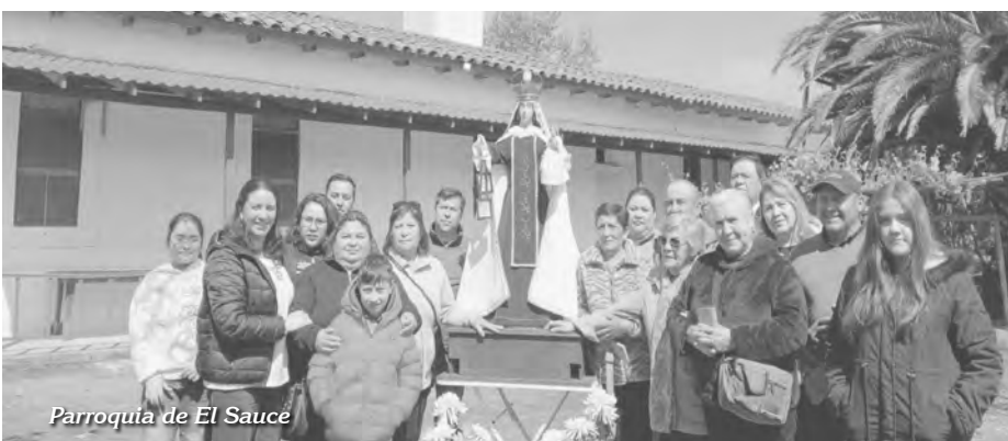
Parroquia de El Sauce