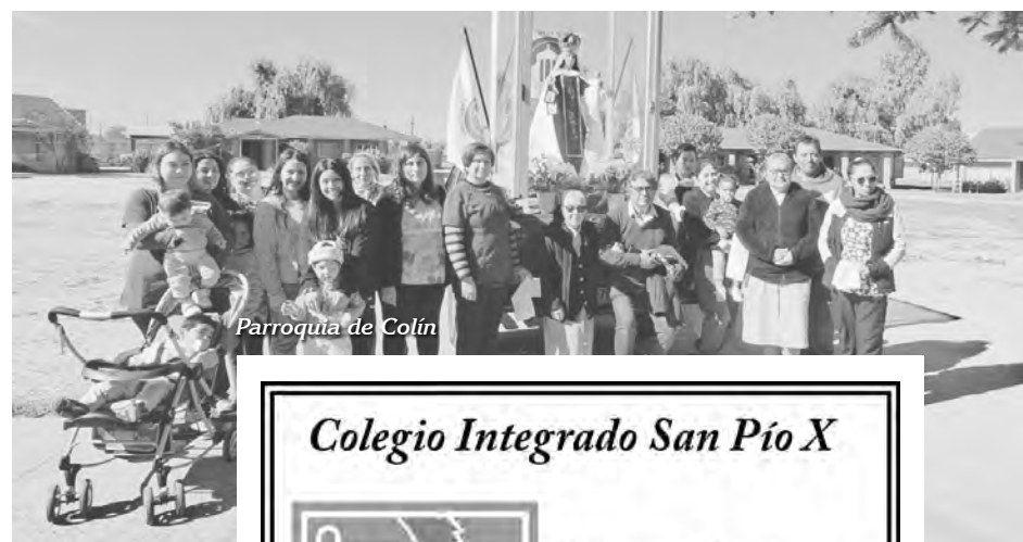
Parroquia de Colín