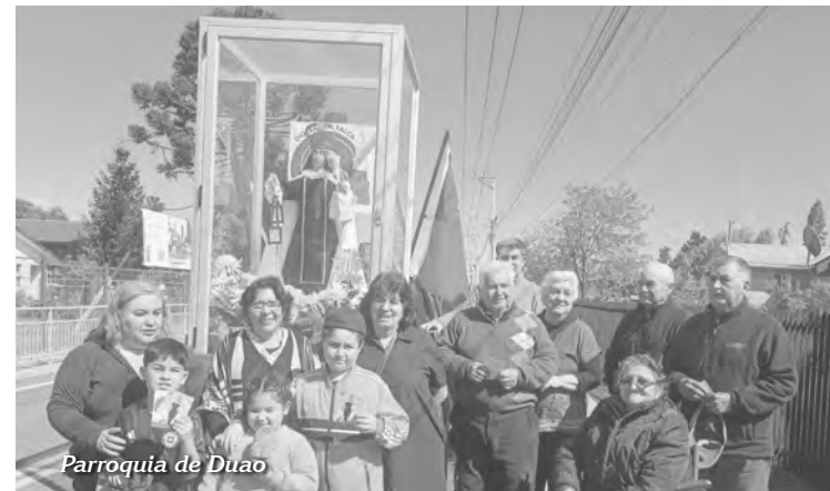
Parroquia de Duao