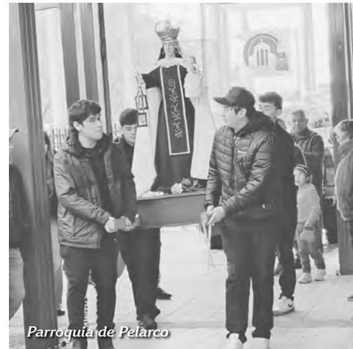
Parroquia de Pelarco